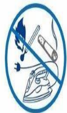
ЗАЖИГАТЬ СПИЧКИ, КУРИТЬ, ВКЛЮЧАТЬ И ВЫКЛЮЧАТЬ ЭЛЕКТРОПРИБОРЫ