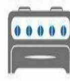
ЗАКРЫТЬ КРАНЫ НА ГАЗОВЫХ ПРИБОРАХ